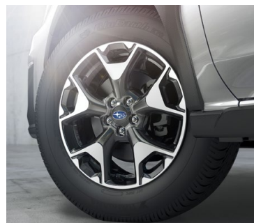
17" легкосплавные диски