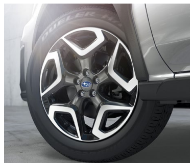
18" легкосплавные диски