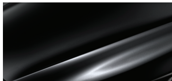
ЧЕРНЫЙ МЕТАЛЛИК (CRYSTAL BLACK SILICA)